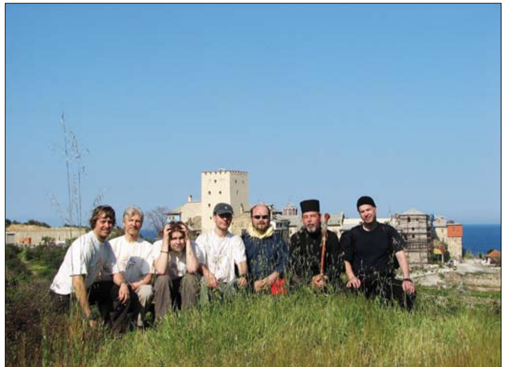
Palverändurid Megisti Lavra kloostri ees.

Järgmiseks läksime Ivroni kloostri, mis, nagu nimigi viitab, on gruusia munkade rajatud (Gruusia vana nimetus on Iveria). Seal asub kuulus Portaitissa, Jumalasünnitaja Uksevalvuri ikoon, mille üks Nikaia lesk lasi pärimuse järgi ikonoklastide ajal merre, et seda hävitamisest päästa. Ikoon ujus Athose lähedale, kus mungad tõid ta Ivroni kloostri ning panid kirikusse, hommikul leidsid selle aga värava kõrvalt. Nad mõtlesid, et keegi teeb rumalat nalja ja panid ikooni kirikusse tagasi, järgmisel päeval oli see aga taas värava juures. Nii toimunud see mitu korda, kuni leiti, et ju see on siis ikooni õige koht ning ehitati selle ümber kabel. Värava järgi saigi ikoon nimeks Portaitissa. Üks munk on seda kunagi meeltesegaduses noaga lõõnud, nii et Jumalasünnitaja kaela peal on vere jälg. Seda ei ole aga praegu näha, sest ikoon on kaetud hõbedase riisaga. Pärast õhtuteenistust mindi alati kabelisse Jumalasünnitaja ikooni ette palvetama.