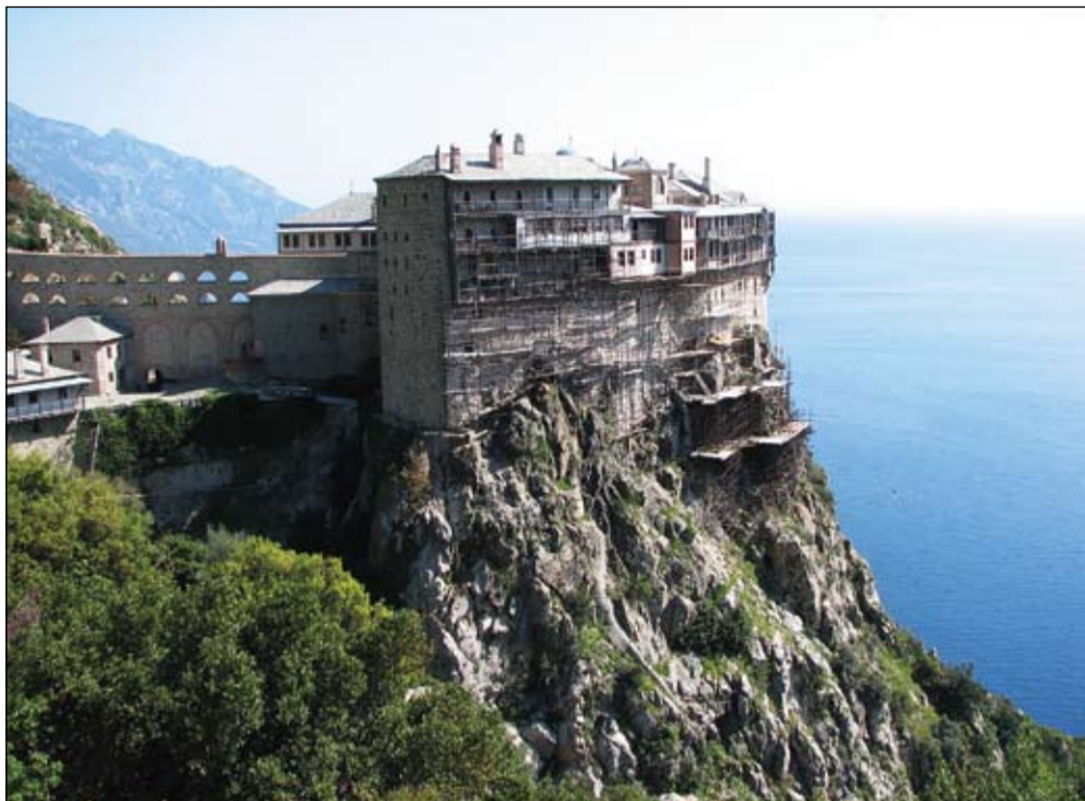
Simon Petraste klooster.

peidus. Olukord olnud munkade jaoks päris hull juba 1970ndatel aastatel, mil mitmed neist lahkusid Meteorast ja läksid Simon Petraste kloostri. Athosele pääseb küll suhteliselt vabalt, aga turistidevool on siiski oluliselt väiksem kui Meteoras, kuhu saab igaüks ligi. Athosele minekuks tuleb siiski natuke vaeva näha, hankida diamonitirion ehk viisa ja leida majutus. Meiegi reis oli eelnevalt kooskõlastatud ning patriarhilt õnustus küsitud, sest Athos ei allu mitte Kreeka kirikule, vaid Konstantinoopoli patriarhile.