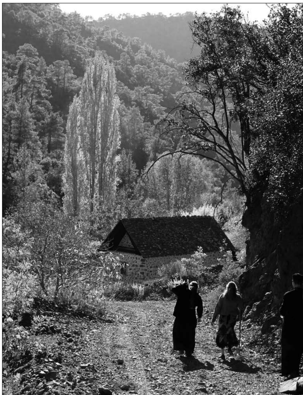
Palverännak Kykko mäeorus asuvasse püha Andrease kabelisse.

Lisaks Kykko kloostri külastasime ka teisi pühapaiku. Viimastest tooksin eeskätt esile Mahhera Jumalasünnitaja ja Johannes Ölilambihoidja kloostrid. Mahhera munkla ukсед on palveränduritele avatud vaid mõne päeva nädalas, sealed mungad püüavad järgida Athose kloostri traditsioo-