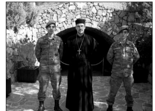
Küprose kaitseväge Kykko auvahtkonnaga Kykko mäe tipus asuva Küprose esimese presidendi peapiiskop Makariose (+ 1977) mausoleumi ees.