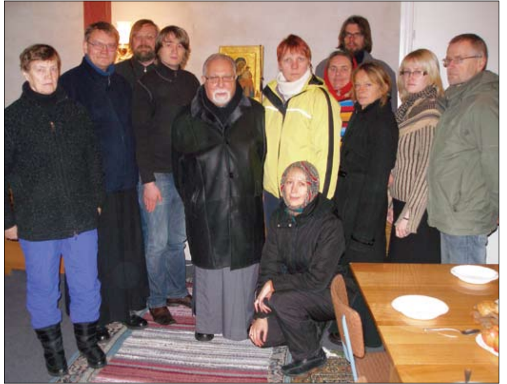
Paastu- ja palvelaager Tallinna Issanda Muutmise koguduses.