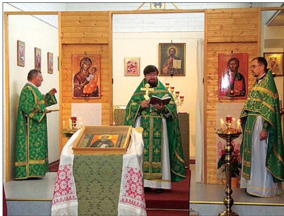
Soome- ja eestikeelne liturgia Helsingi Mellunmäe koguduses.