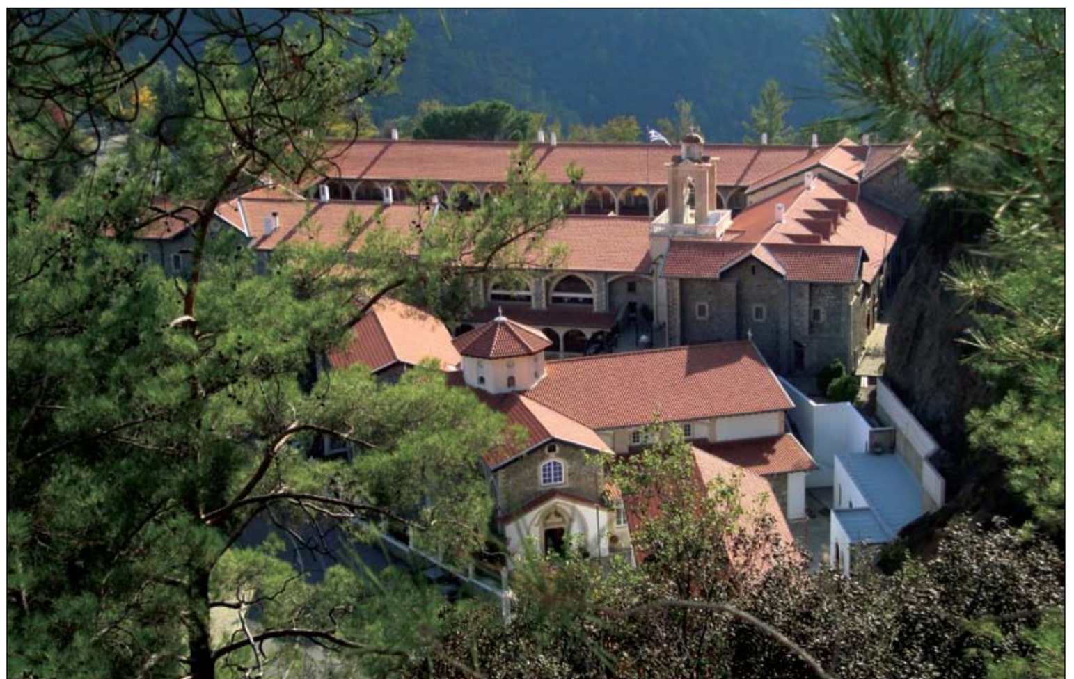
Kykkö Jumalasünnitaja klooster.