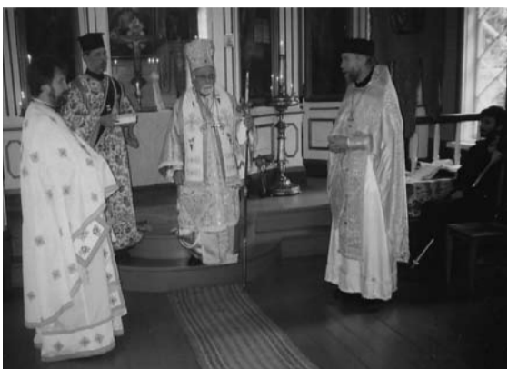
hetk piiskoplikust liturgiast Treimanis

13. augustil tähistas Treimani Apostlite Peetruse-Pauluse kogudus liturgia ning ühise einega oma kiriku sissepühitsemise 65. aastapäeva. 1940. aasta augustis pühitses pühakojat metropoliit Aleksander. Koguduse tegevuse algust arvestatakse 1920. aastast.