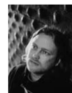
toimetanud Johannes Sakarias Leppik

Venemaal on umbes pool miljonit vanausulist. Nad löid õigeusu kirikust lahku, protesteerides patriarh Nikoni juhitud liturgiareformi vastu 17. sajandil.