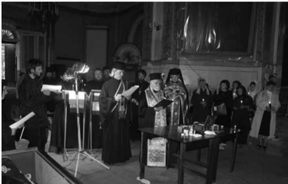
Pühade Nikolai ja Mihhaili säilmete avamise õhtuteenistus Tartu Unsepenki kirikus 2005.a