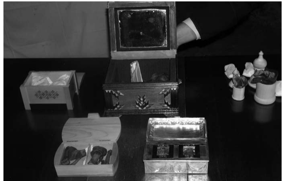
Святые мощи в Тартуском Успенском соборе

В богослужебных книгах Православной Церкви и в творениях великих святых отцов о мучениках сказано, что страдая с Христом, они делаются хмельными от крови, вытекающей из прободенного Христова ребра и сторают в пламени