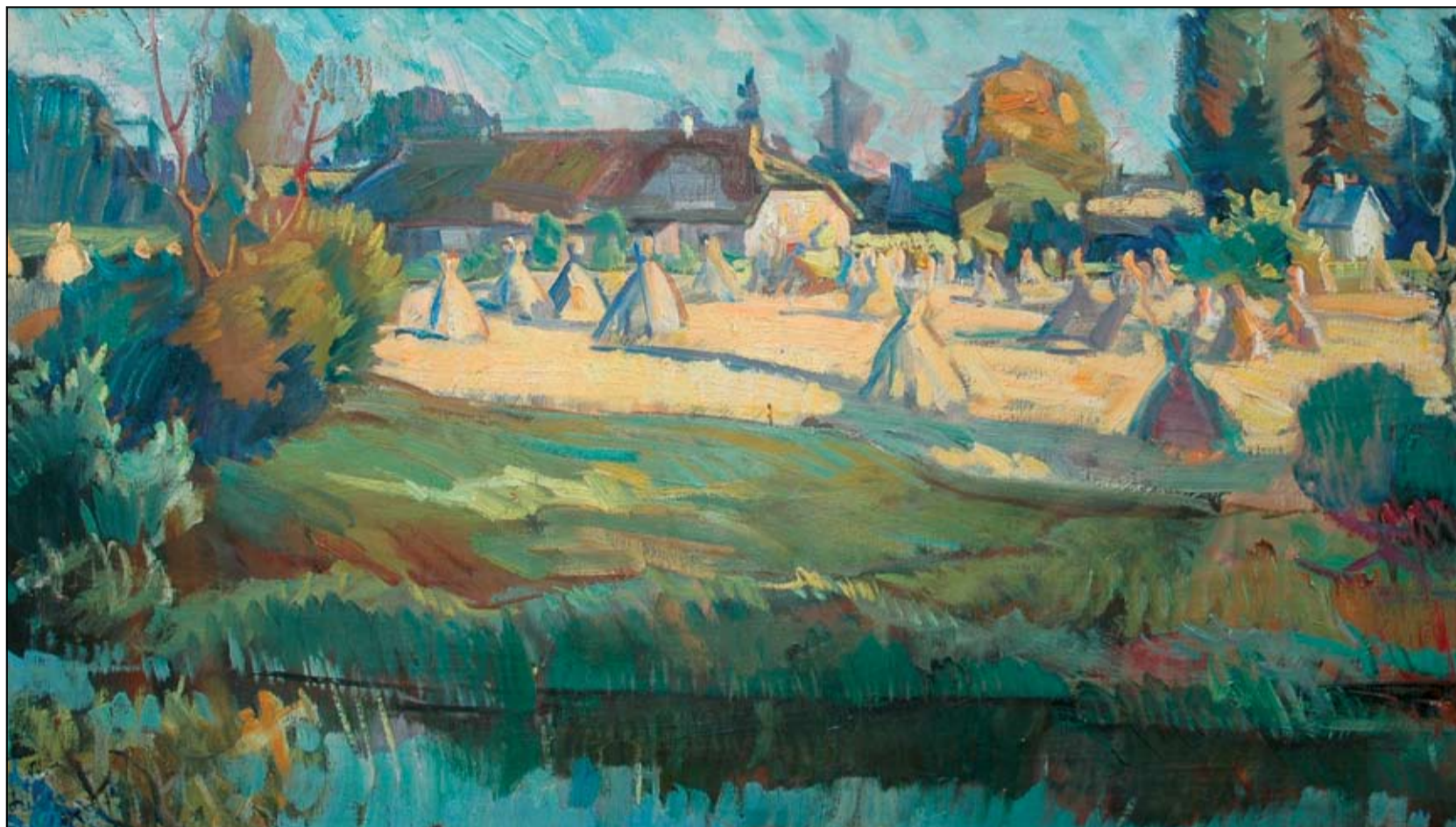
August Jansen, „Taluvaade rukkiahakkidega”, 1956, õli. Erakogu