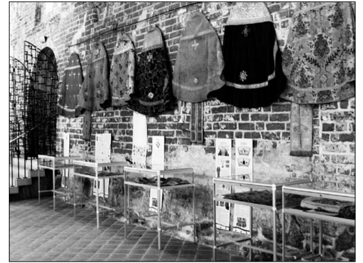
Näitus Tartu Jaani kirikus, aprillis.