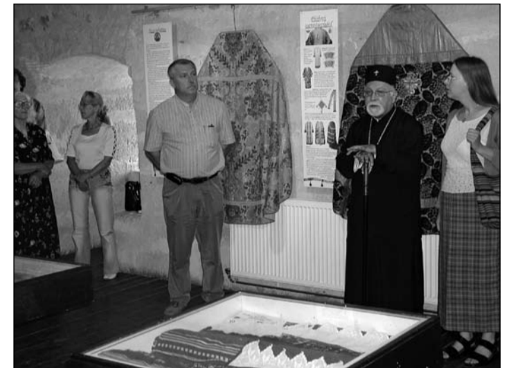
Näitus Saaremaal Kuressaare linnuses, 9. juuli.