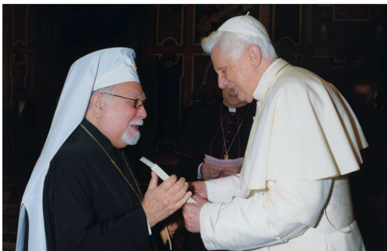
Metropoliit Stefanus ja paavst Benedictus XVI Roomas, kus 9.-12. novembrini 2009 leidis aset 6. ülemaailmne pagulaste ja põgenike hingediivõ-alane konverents.

Me tunnistame armu, kuulutame halastust, ei varja heategusid. (Suurest veepühitsuspalvest)