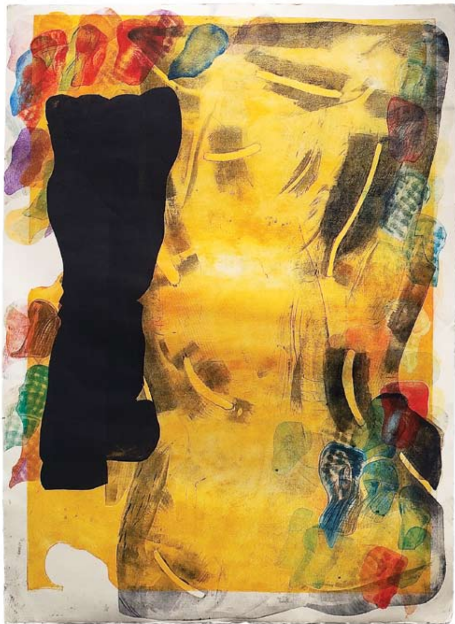
Peeter Ulas „Vana mees ja mere kujund”. 2008. Sügavtriikk, paber 110 x 78 cm. Erakogu.