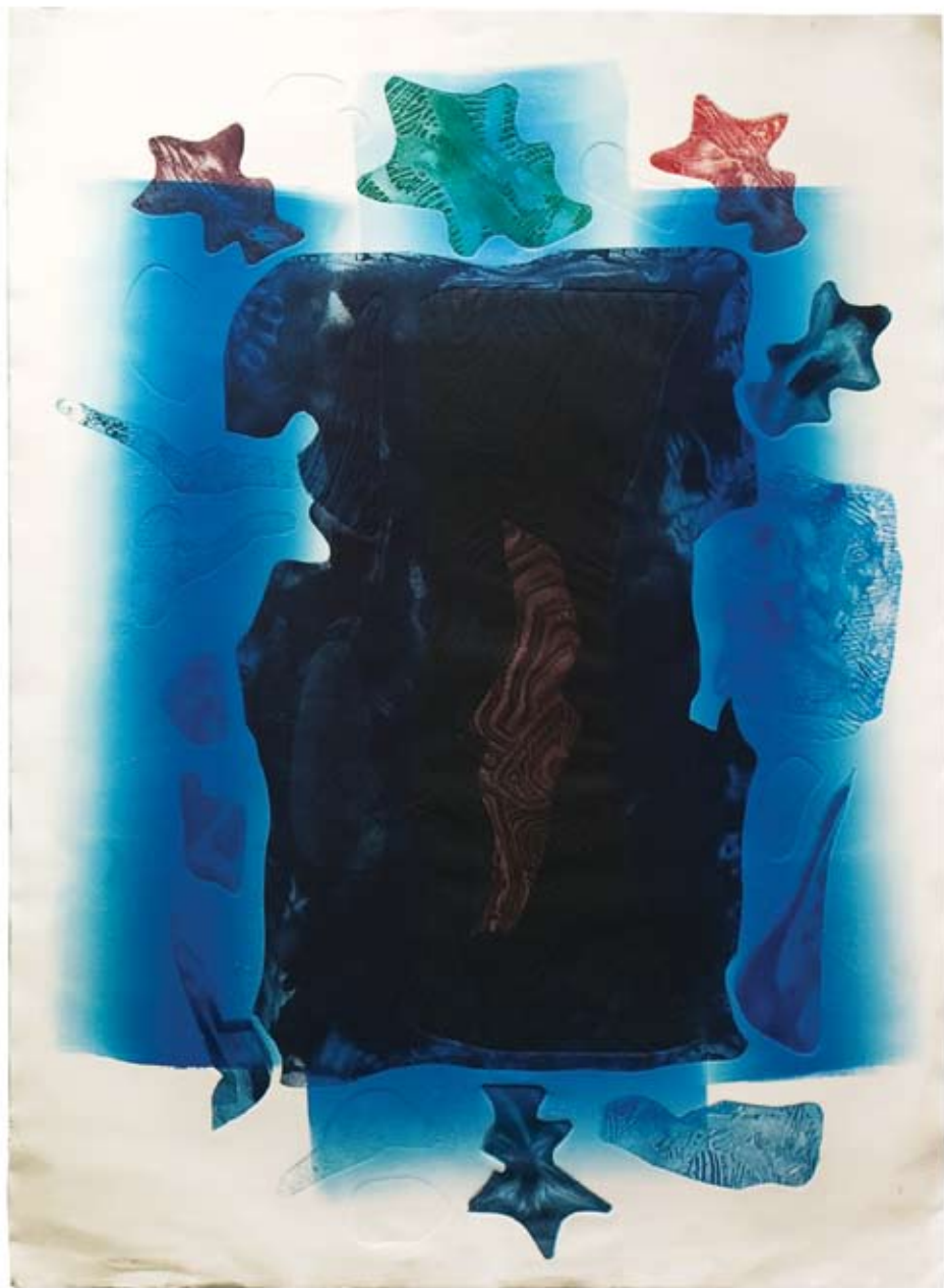
Peeter Ulas „Vana mees ja mere kujund”. 2008. Sügavtrükk, paber 110 x 78 cm. Erakogu.