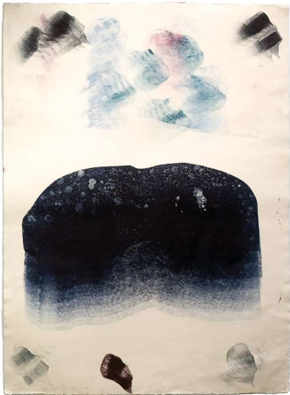
Peeter Ulas „Nimeta”. 2008. Sügavtrükk, paber 110 x 78 cm. Erakogu.