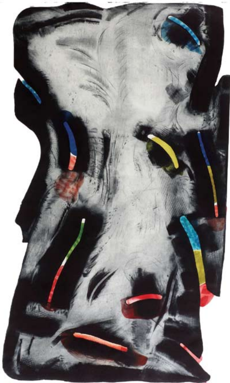
Peeter Ulas „Seepärast siis”. 2004. Kuivnõel, mezzotinto, paber 110 x 78 cm. Erakogu (Eduard Wiiralti kunstiauhind 2004).