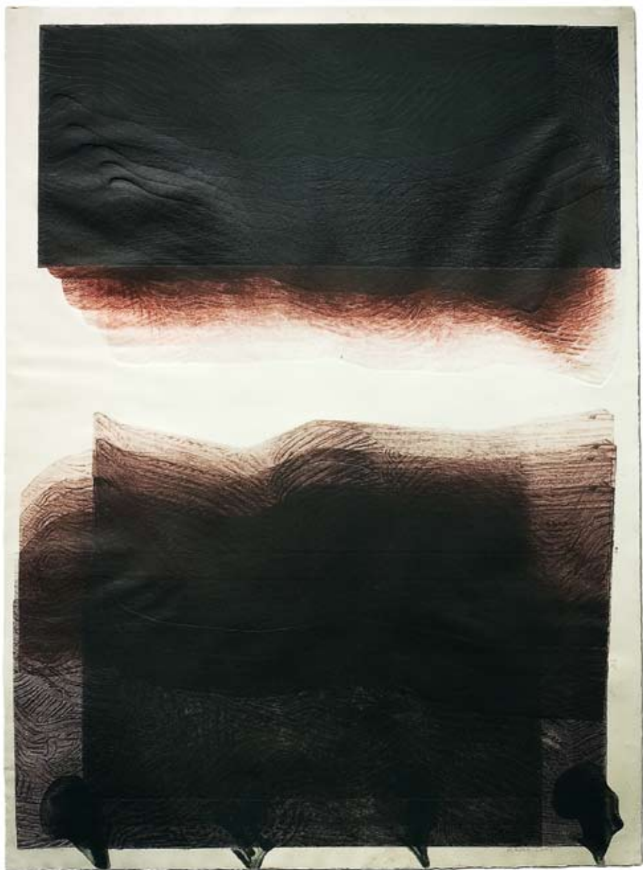
Peeter Ulas „Pidulik graafika”. 2008. Sügavtrükk, paber 110 x 78 cm. Erakogu.