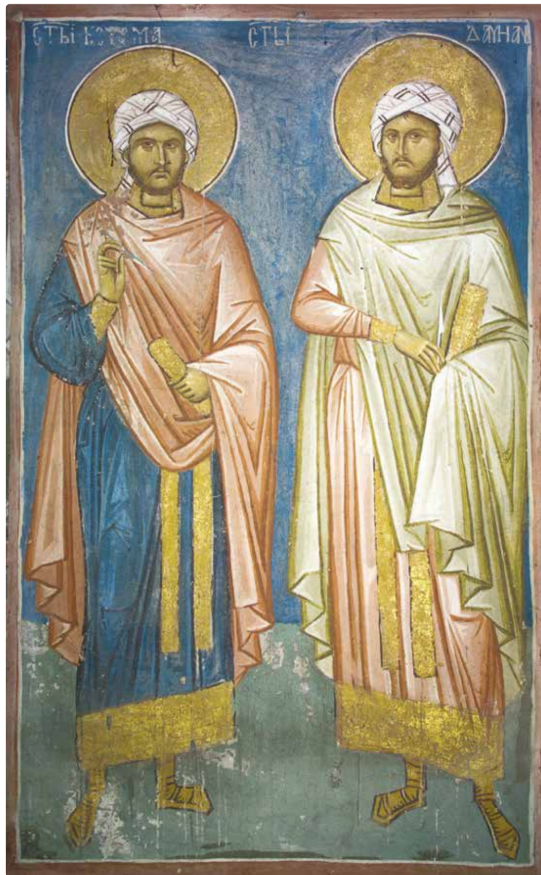
Pilhad kasupüüdmatud tervendajad Kosma ja Damjan. Fresko. Dečani klooster, Serbia.

Me tunnistame armu, kuulutame halastust, ei varja beategusid. (Suurest veepühitsuspalvest)