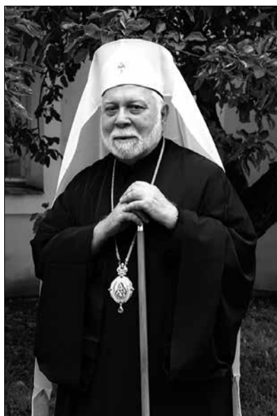
Фото: Геннадий Баранов 2019