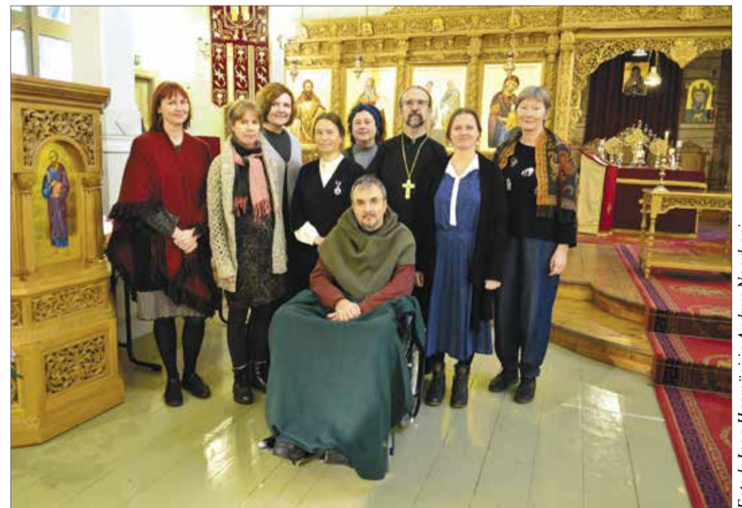
Terje koos püha Siimeoni ja naisprohvet Hanna kooriga.